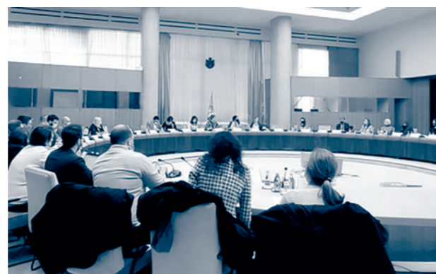
BELGRADE, 16.3.2022, thematic session of the Council devoted to the concluding observations of the ICESCR and CAT

In May 2022, thematic sessions of the Council were held, where members of the Council were presented with the findings from the alternative reports and the state reports on the application of the Convention on the Rights of the Child. The session was also attended by children from the DX Centre for Rights of the Child club, who had an opportunity to state their views, suggestions and initiatives for future activities which may improve the status of children and young people. Certain suggestions and views from the alternative reports, as well as those of the children from the DX Centre club, were incorporated in the state report , with the agreement of the representatives of the competent line ministries. As a result of the dialogue at the session of the Council, alternative reports were, for the first time, submitted as an Annex to the state report, which was also confirmed by the conclusion of the Government of the Republic of Serbia. 4