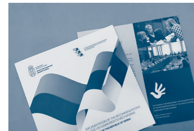
ЖЕНЕВА, 19.9.2019, 42. заседање Савета за људска права УН-а, Национални механизам за људска права