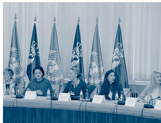
БЕОГРАД, 22.9.2022, представљање Инструмента за примену ЛНОБ принципа

Сарадња са међународним организацијама је од самог почетка постављена на партнерским и јаким основама. Тим за људска права УН-а у Србији и Мисија ОЕБС-а у Србији су снажно подржавали и помагали како оснивање Савета, тако и његов рад. Такође, значајна је улога UNICEF-а и канцеларије UN WOMEN-а, нарочито у погледу заједничких пројектних активности.