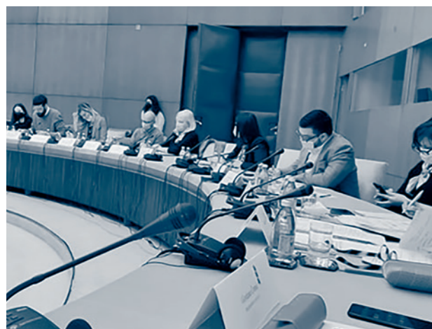
BELGRADE, FEBRUARY 9, 2022, thematic session of the Council dedicated to the implementation of the ICESCR

Cooperation with civil society organisations within the Council also facilitated the deepening of the cooperation between the Ministry of Human and Minority Rights and Social Dialogue, and thus such organisations were invited and took part in instances of social dialogue organised by the Ministry. Also, together with the UN Human Rights Unit and representatives of the academic community, the Instrument for the application of the principle "Leave No One Behind" was developed ( https://www.minljmpdd.gov.rs/publikacije.php ), and a kind of resource center has been established on the website of the Ministry by posting publications of the organizations from the Platform, in order to contribute to informing the general public on human rights matters ( https://www.minljmpdd.gov.rs/publikacije-ocd.php ).