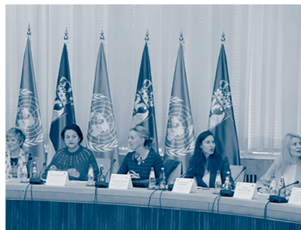
BELGRADE, 22.9.2022, presentation of the Instrument for the implementation of the LNOB principle

Cooperation with international organisations has, from the start, been strong and based on partnerships. The UN Human Rights Unit in Serbia and the OSCE Mission to Serbia strongly supported and assisted both the establishment of the Council and its work. The role of UNICEF and UN Women is also important, in particularly with respect to joint project activities.