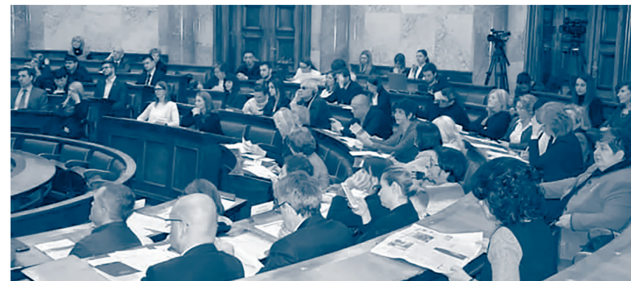
БЕОГРАД, 29.3. 2018, НАРОДНА СКУПШТИНА РЕПУБЛИКЕ СРБИЈЕ, представљање закључних запажања Комитета за права детета

Представници Платформе и других организација цивилног друштва су редовно присуствовали и учествовали у седницама Савета, а јачању међусобне сарадње сведочи заједничка израда Плана праћења препорука, одржавање тематских седница на иницијативу чланица Платформе, „стална столица“ за представнике Платформе загарантована Пословником Савета и представљање алтернативних извештаја члановима Савета.