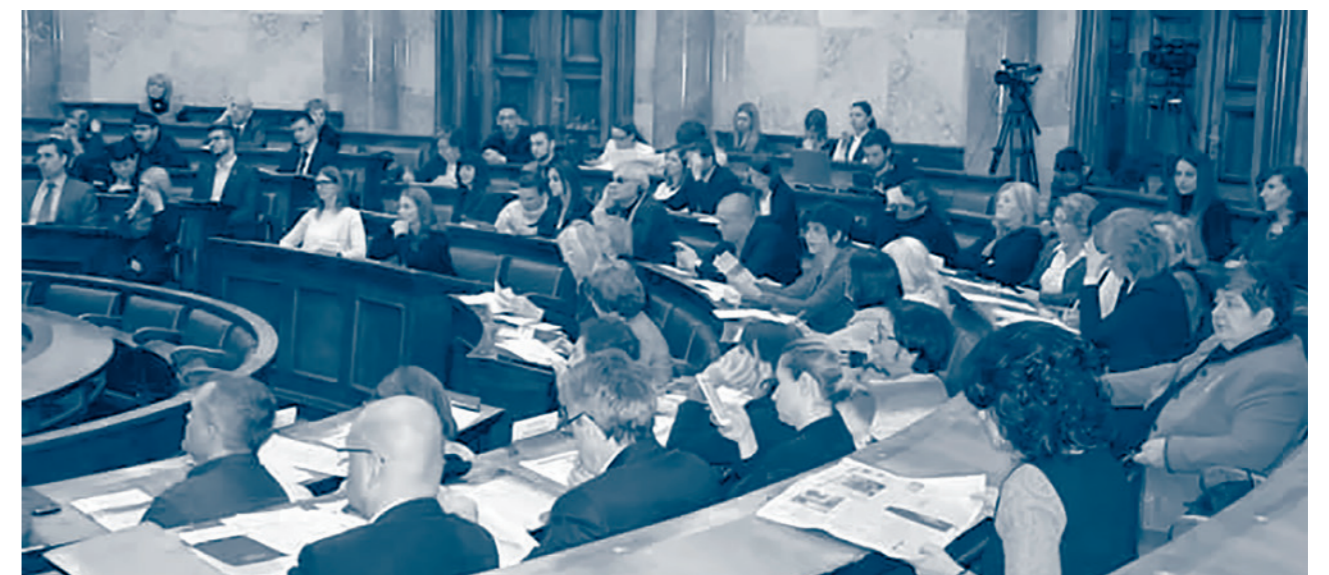
BELGRADE, 29.3. 2018, NATIONAL ASSEMBLY, presentation of the concluding observations of the CRC

Representatives of the Platform and other civil society organisations regularly attended and participated in sessions of the Council. The strengthening of mutual cooperation was reflected in the joint development of the Plan for Monitoring the Recommendations, thematic sessions at the initiative of the members of the Platform, Permanent Chair for representatives of the Platform guaranteed by the Rules of Procedure of the Council and presentation of alternative reports to the members of the Council.