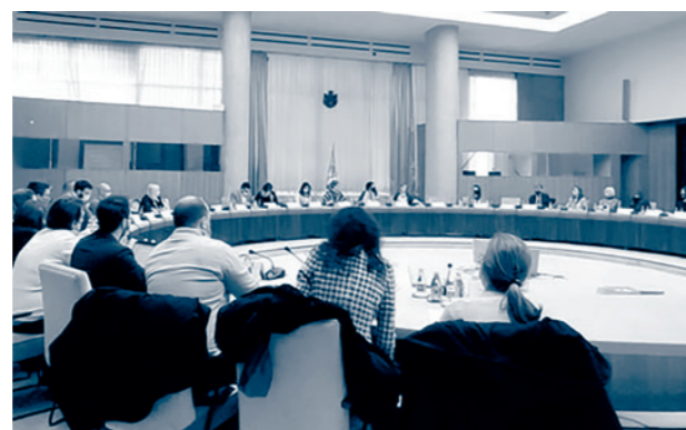
БЕОГРАД, 16.3.2022, тематска седница Савета посвећена закључним запажањима Комитета за економска, социјална и културна права и Комитета против тортуре

У мају 2022. године одржана је тематска седница Савета на којој су члановима Савета, представљени налази из алтернативних извештаја и из државног извештаја о примени Конвенције о правима детета. Седници су присуствовала и деца из клуба ДХ Центар за права детета и имала су прилику да изнесу своје ставове, сугестије и иницијативе за будуће активности којима се може унапредити положај деце и младих. Поједине сугестије и ставови из алтернативних извештаја, као и деце из клуба ДХ Центар за права детета, уграђени су у државни извештај , а сагласношћу представника надлежних ресорних министарстава. Као последица дијалога на седници Савета, алтернативни извештаји су, по први пут, приложени као анекс државног извештаја, што је потврђено и закључком Владе Републике Србије. 4