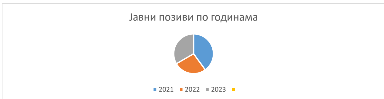
Графикон 1. Преглед расписаних Јавних позива по годинама

Када је у питању број организација које су показале заинтересованост за учешће у процесима израде и доношења прописа и докумената јавних политика, односно оних које су учествовале у јавним позивима у 2023. години, укупно је поднета 141 пријава од стране 88 различитих ОЦД-а у оквиру 15 јавних позива. Од наведеног броја пријава предложено је за укључивање у радна/саветодавна тела 100 чланова и 90 заменика чланова из 62 различите ОЦД (поједини јавни позиви имали су за циљ само избор члана не и заменика члана). То практично значи да је око 70% заинтересованих организација за учешће у процесу израде прописа и документа јавних политика предложено за именовање у радним групама/саветодавним телима.