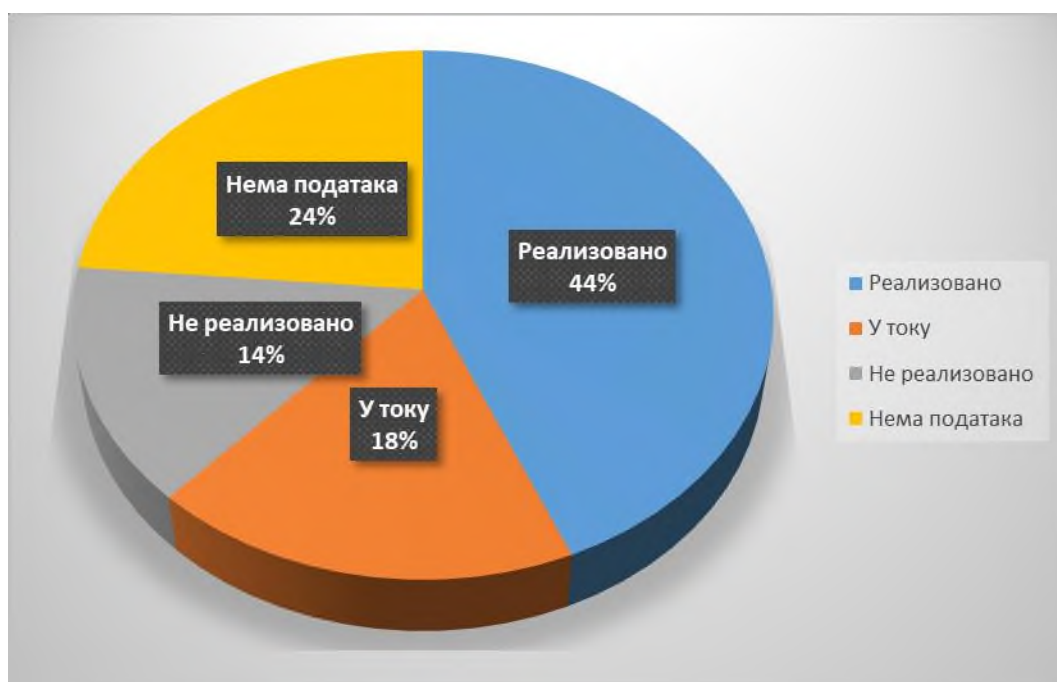
Слика 1: Процент реализације активности из Акционог плана за спровођење Стратегије за родну равноправност (2021-2023) за 2022. годину

10 активности (18%), није започето са реализацијом 5 активности (14%), док о статусу реализације 13 активности (24%) из надлежности Министарства здравља, нису достављени подаци ни након упућивања дописа и више ургениција од стране ресорног Министарства са захтевом том органу да достави податке потребне за извештавање (Слика 1). Разлози за одступања у реализацији појединачних активности у 2022. години, у односу на планиране рокове у Акционом плану, опширније су образложени у табеларном садржају извештаја о реализацији Акционог плана у Јединственом информационом систему (ЈИС) који се води у РСЈП. Ресорно Министарство је израдило и РСЈП и Влади поднело и први Извештај о спровођењу Акционог плана у 2022. години.